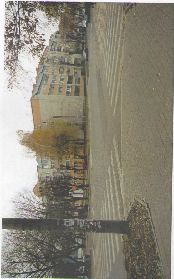
Перекресток улиц Ключевина и Платова