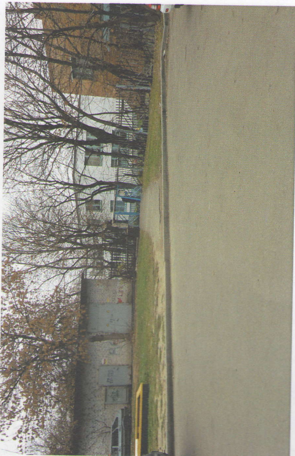
Подход с улицы Ключевина